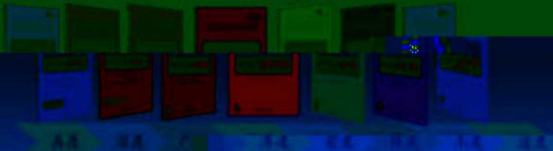
PLC 控制技术 机电一体化技术 数控技术 工业机器人技术 智能制造技术